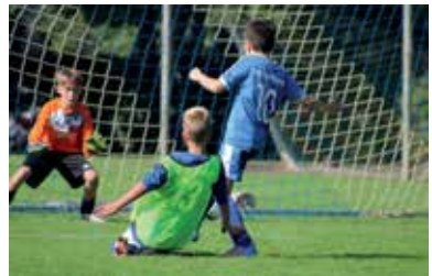
E1-Junioren bei "Kinderfestival" aktiv