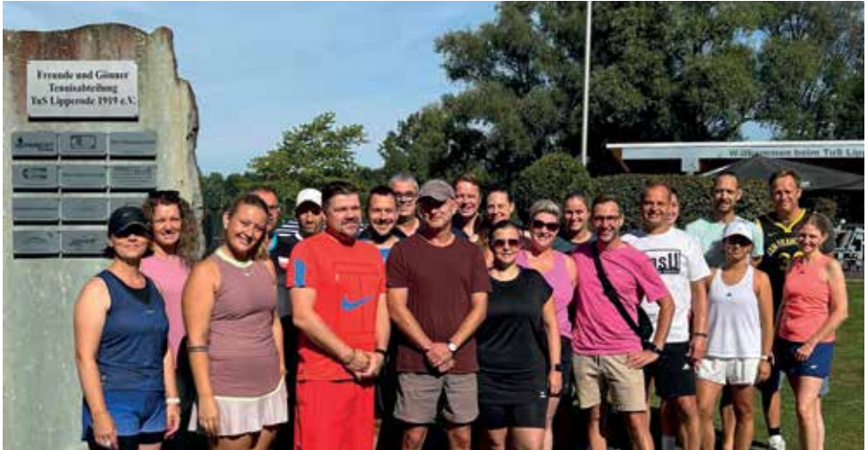
Die Teilnehmer der Elli-Open strahlen mit der Sonne um die Wette