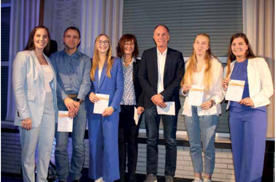
TuS feiert Festabend in blau und weiß