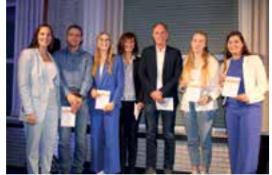
TuS Festabend in blau und weiß

Zum Jahresende fand auch wieder die Blau-Weiße-Nacht statt. Hier hat das Orga-Team eine wunderschöne Veranstaltung in der Schützenhalle organisiert und einen passenden Rahmen für unsere Jubilare geboten. Ich persönlich konnte leider nicht teilnehmen und möchte hier nochmal allen Ausge-