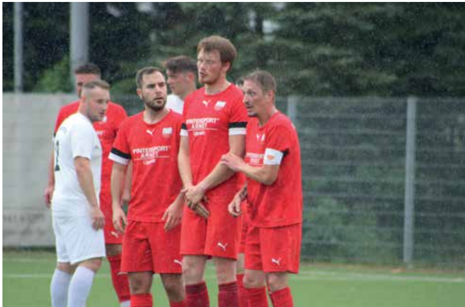
Nur gemeinsam kann sich die Dritte erfolgreich gegen den Abstieg stellen