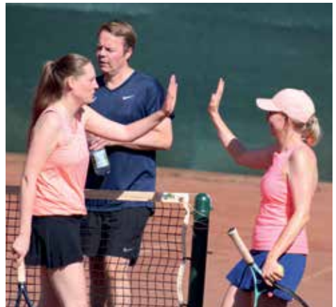
Teamwork ist im Doppel der Erfolgsschlüssel